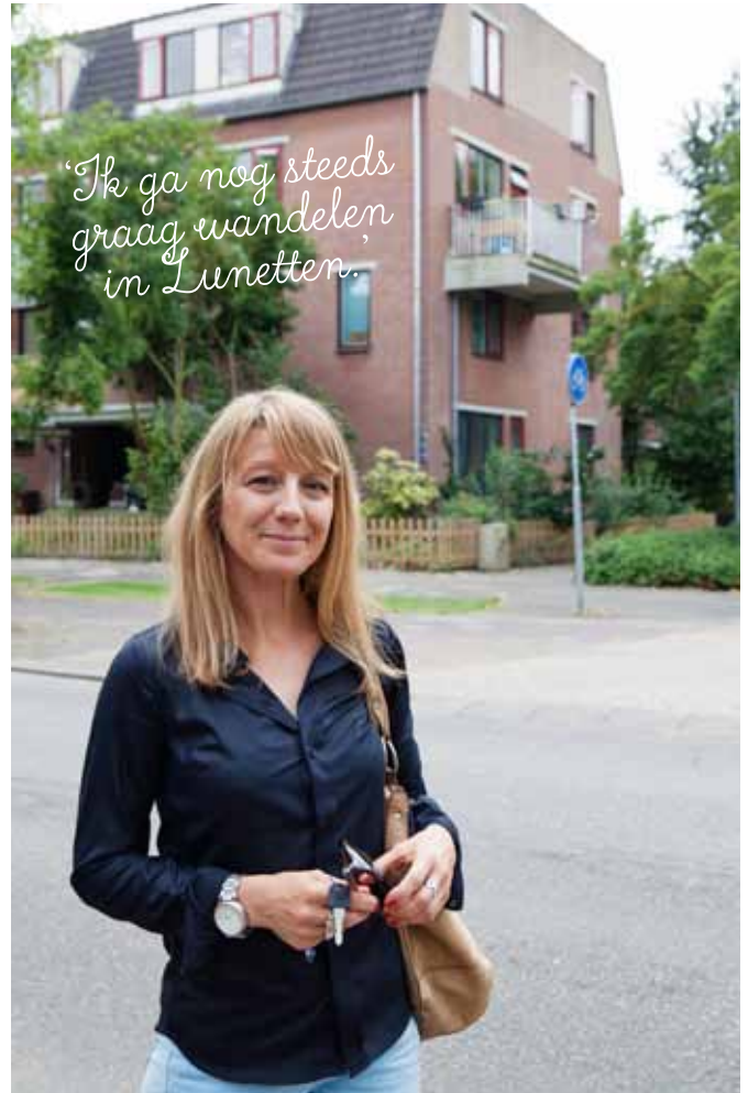
TEKST LISETTE LE BLANC

Kim: 'Alles is bereikbaar en je hebt geen parkeervergunningen nodig. Lekker makkelijk.' Ze komen van een flat uit Hoograven. Ook al hadden ze daar een mooi uitzicht, soms was het onhandig als je wat vergeten was en je al die trappen weer op moest. Hun nieuwe huis met de schitterende tuin is zeer fijn: 'We zijn heel blij in deze wijk, ook met de mensen in de straat.'