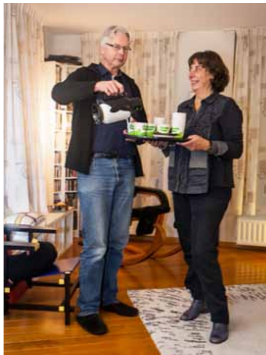
Helen: 'We hoeven alleen maar thee en koffie te schenken, de organisatie denkt aan alles.'

TEKST SJEF VAN HOOF