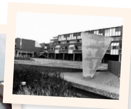
Flinterman en Van Wijk ontwierpen voor het winkelcentrum combinaties van driehoeken en rechthoeken, waarvan dit een onderdeel is. In 2008 werd dit kunstwerk afgebroken.