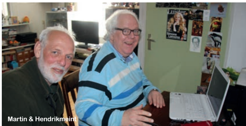
Martin & Hendrikmeint

LUNETTEN WIL WEL Wijkinitiatief Lunetten Wonen & Leven