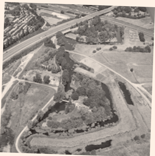
Luchtfoto uit 1977 van Lunetten III (boven) en Lunetten IV (onder)