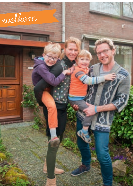
TEKST LISETTE LE BLANC

Op woensdagmiddag 17 mei organiseert de speeltheek op kinderboerderij Koppelseede een leuke lenteknutsel, van 14u tot 16.30u.. Iedereen is welkom!