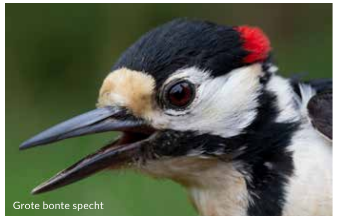
Grote bonte specht

Ik zet het raam verder open en luister naar geluiden in onze straat. Geluiden die ik normaal eigenlijk nooit zo duidelijk hoor. Het zijn vogels. Véél vogels. Twee heggenmussen zingen hun longen uit het lijf en vliegen elkaar af en toe flink in de haren. Een prachtig zwartgekleurde merel laat zijn lied vanaf de dakrand horen en krijgt concurrentie van nog twee merels verderop in de straat. Een roodborst riedelt, twee koolmezen en pimpelmezen schelden elkaar het verenkleed vol, een tjiftjaf blijft onvermoeibaar zijn naam herhalen (tjif-tjaf-tjif-tjaf-tjaf) en een houtduif koert zachtjes vanuit de moeraseik tegenover ons huis. En ik hoor nog veel meer. Groenling, putter, Turkse tortel, boomkruiper, winterkoning, ekster, kauw, zwarte kraai en vink, allemaal gewoon in een straat in Lunetten. Ik hoor zelfs hommels voorbij zoemen. Vanuit het Beatrixpark bereiken de geluiden van een grote bonte specht, groene specht, boomkruiper en zelfs een ijsvogel onze straat.