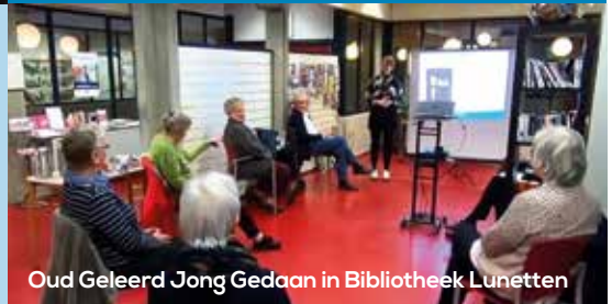
Oud Geleerd Jong Gedaan in Bibliotheek Lunetten