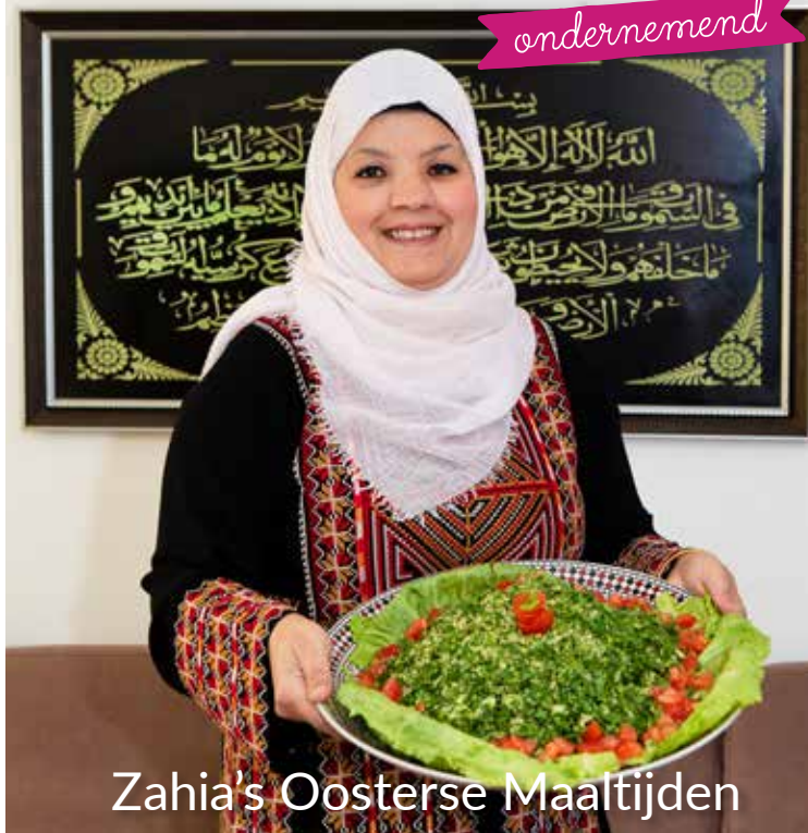
Zahia's Oosterse Maaltijden