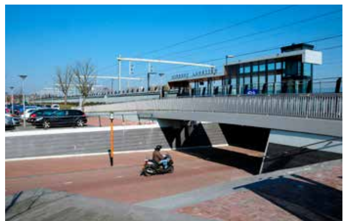
Het huidige station Lunetten.