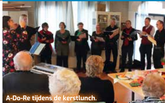
A-Do-Re tijdens de kerstlunch.

December 2022 was een echte feestmaand met op tweede kerstdag weer een goed bezochte kerstlunch. Albert Heijn Lunetten had de boodschappen weer voor zijn rekening genomen en het koor A-Do-Re zorgde voor het muzikale toetje. Meer muziek was er op donderdag 29 december bij het Appeltaartconcert. In het kader van het Internationaal Kamermuziek Festival Utrecht bracht Appelduduk muziek uit Armenië, Syrië, Moldavië en Oekraïne (Odessa) ten gehore. Door de vele bezoekers werd volop genoten en natuurlijk was er tot besluit een lekker stukje appeltaart.