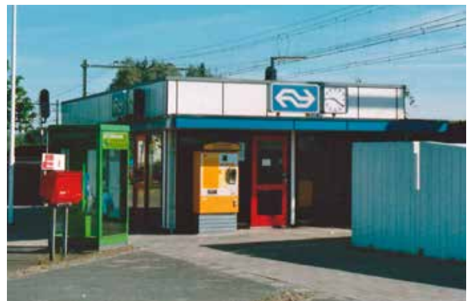
Noodgebouw voor kaartjesverkoop (1997).

Veel bewoners maken gebruik van de trein en ook veel scholieren. Het station is niet meer weg te denken in de wijk. Het station werd bij de uitbreiding naar vier sporen weer verplaatst naar 250 meter verderop met een onderdoorgang voor fietsers en wandelaars. Het was in 2016 gereed. Vanaf station Lunetten kun je mooi wandelen via de Koningsweg langs de Oosterspoorbaan naar het oude Maliebaanstation.