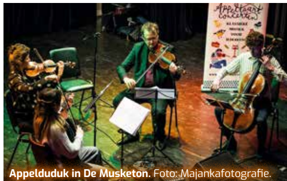
Appelduduk in De Musketon.