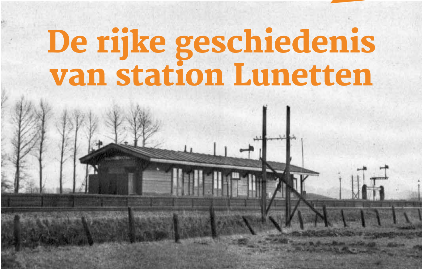
Het houten overstapstation Lunetten (1935).

Ons station heeft een lange geschiedenis die teruggaat tot in de negentiende eeuw.