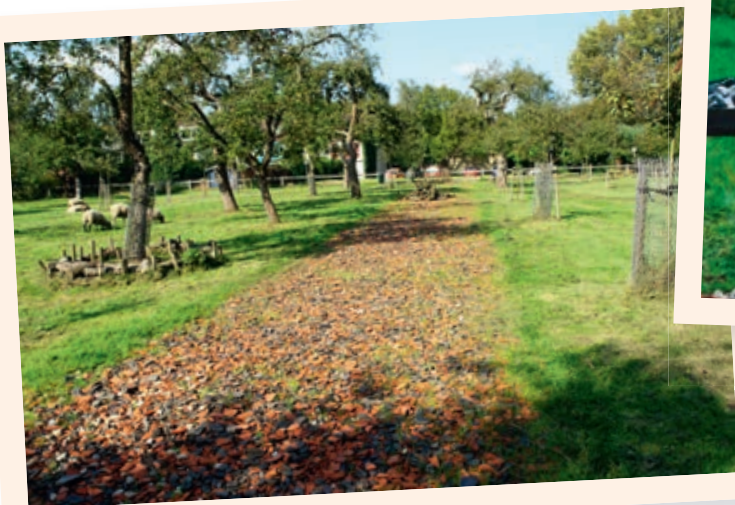
Visualisatie van de Limesweg in de boomgaard van de kinderboerderij De Koppel

‘We kunnen fantaseren dat ze hier gelopen hebben.’