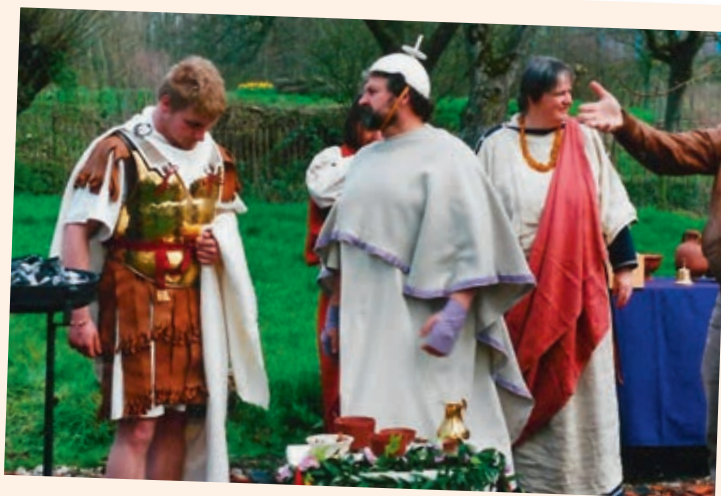
Inwijding van de Limesweg in de boomgaard op 6 april 2008, door groep Corbulo