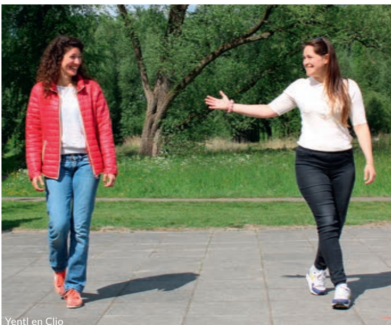
Yentl en Clio

Clio: 'Wat ook bijzonder is: we vieren onze verjaardagen altijd samen. Een dag van tevoren rijden we op de elektrische scooter naar een café buiten Lunetten. Om twaalf uur gaan we aftellen, en vragen om een toepasselijk liedje te draaien. Bijvoorbeeld laatst '32 jaar' van Doe Maar. Als het op een maandag of dinsdag valt, blijft het café zelfs langer voor ons open.'