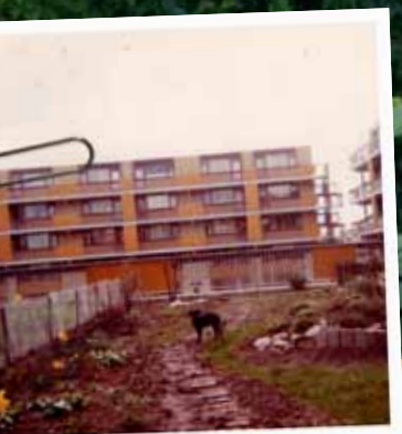
Op foto's uit de jaren tachtig zie je een enorme kale vlakte.

“Wij hebben het enorm getroffen met deze tuin.”