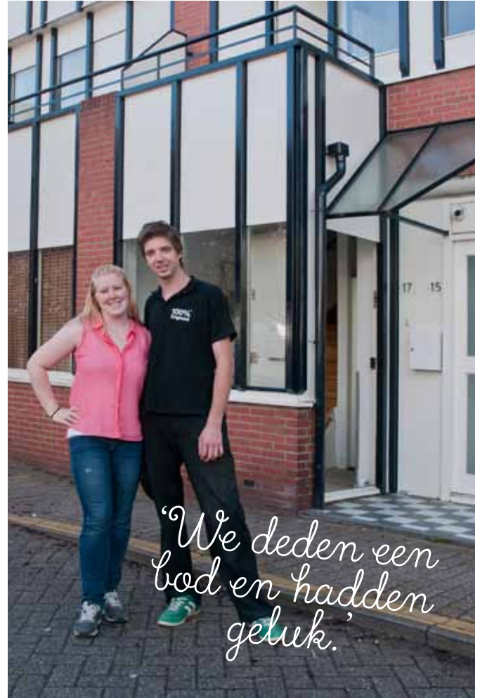
TEKST LISETTE LE BLANC

Behalve commerciële flexplekken, zijn er in de wijk ondernemers die thuiswerkplek(ken) delen met mede-ondernemers. In de Facebookgroep Bedrijven in Lunetten vind je daarover meer informatie.