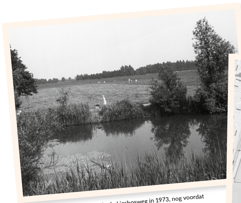
Het inundatiekanaal met de Oude Liesbosweg in 1973, nog voordat Lunetten was gebouwd.