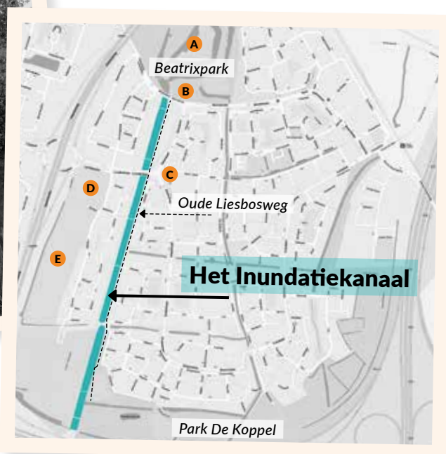
A: Fort Lunet IV, B: Fort Luna C: De Paddestoel, D: Tennisvereniging, E: Sportvelden.