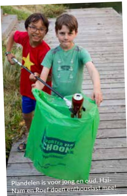
Plandelen is voor jong en oud, Hai-Nam en Roef doen enthousiast mee!

'Restanten van Happy Meals en sigarettenpeuken.'