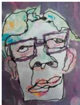
Werk in gemengde techniek van Ans-Klein Hesselink